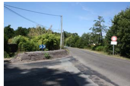
Merlon en terre réalisé sur le chemin de la Môle