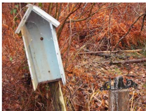
La fontaine vandalisée en début d'année retrouve une nouvelle jeunesse