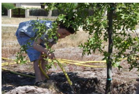
Un grand frère prend soin de l'arbre planté pour sa soeur

Après le pot, les invités ont participé à la plantation symbolique d'un arbre sur l'espace vert communal du Lac en Bernon, le dernier des neuf chênes plantés pour fêter les bébés de l'année.