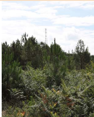
Pylône installé sur un terrain à la Môle pour accueillir les antennes

Nous restons dans le même esprit de communication et de transparence sur ce sujet sensible afin de trouver les solutions qui puissent satisfaire le plus grand nombre.