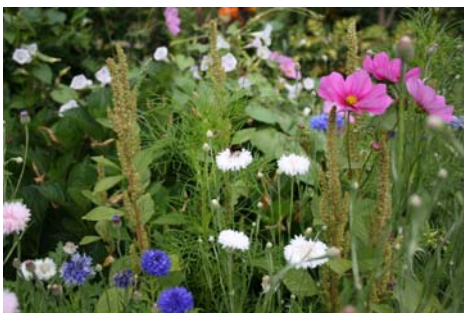
Prairie fleurie à l'Espace Gemme

D'autres part, pour respecter les objectifs budgétaires fixés par la municipalité, des choix ont été faits et des priorités affirmées. Par exemple, l'aménagement de certains giratoires et la réfection des pelouses ont été reportés. L'achat de plantes vivaces a été préféré à celui d'annuelles pour limiter leur renouvellement.