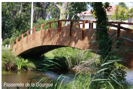
Passerelle de la Gourgue

La passerelle qui enjambe la Gourgue a retrouvé une seconde jeunesse grâce à l'intervention de l'association des Chantiers d'Insertion des Grands Lacs. (travaux Communauté de communes).